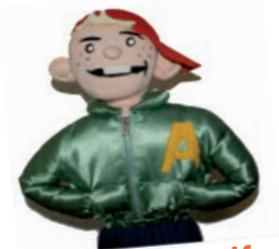
ADJI l'adjectif qualificatif

Ils forment à eux trois le GROUPE NOMINAL. Leur visage n'est pas là par hasard, et leurs caractéristiques grammaticales sont très faciles à retenir.